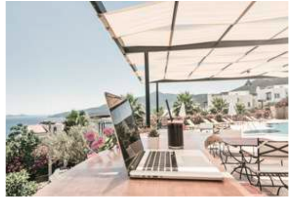
Workation: Urlaub am Arbeitsplatz

Die schönste Verbindung von Arbeiten und Erholen ist „Workation“: Einfach an einem traumhaften Ort mit Strandblick oder Berg-Panorama das Notebook aufklappen und arbeiten, zwischendurch kurz im Meer ein paar Meter schwimmen oder am Buffet stärken. Und nach Feierabend an der Pool-Bar die After-Work-Party einläuten oder die Gegend erkunden. Mit Workation wird der Feierabend zur Urlaubszeit.