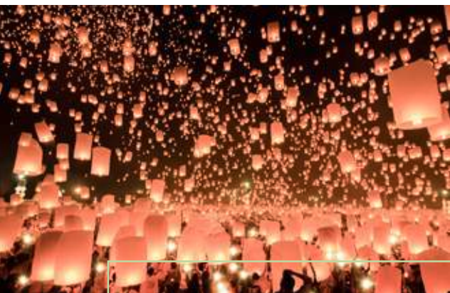
Laternen steigen in den Nachthimmel

Wanderungen im Dschungel, Wasserfälle und erholsame Strandspaziergänge machen Koh Phangan zu einem Ort, an dem es sich gut aushalten lässt. Freunde elektronischer Musik lieben auch die legendären Vollmond-Partys am Haad Rin Beach. Eine der grünsten Inseln Thailands ist Koh Chang, deren Form an einen Elefantenkopf erinnert. Ihre Mangrovenwälder und die Wanderwege der Salak-Phet-Bucht bieten immer wieder neue Natur-Erlebnisse.