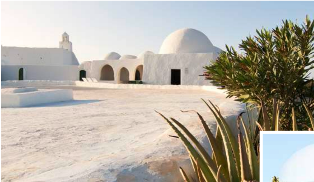
Strahlender Anblick: die alte Fadh-Loon-Moschee

An den malerischen Stränden am hellblauen Meer entlang schlendern und die Seele baumeln lassen, farbenfrohe Kunst und Töpferdörfer kennenlernen und auf den großen Souks Eindrücke ohne Ende sammeln: Auf der größten Insel Nordafrikas bietet jeder Tag viele erlebnisreiche Aktivitäten, die je nach Lust und Laune erholsam oder spannend sind.