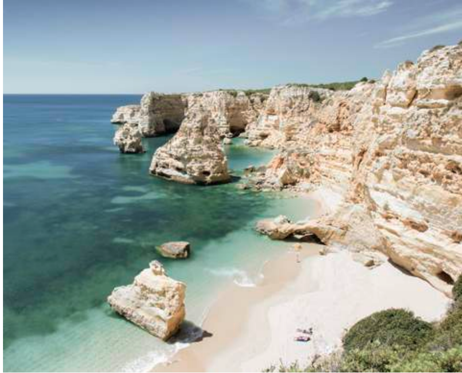
Eindrucksvolle Bade-Landschaft: Der Strand „Praia a Marinha“ an der Algarve