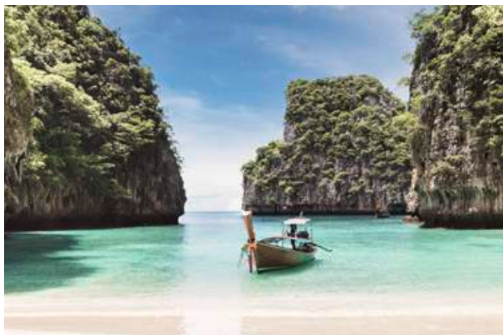
Traditionelles Fortbewegungsmittel der Thais: Longtail-Boote