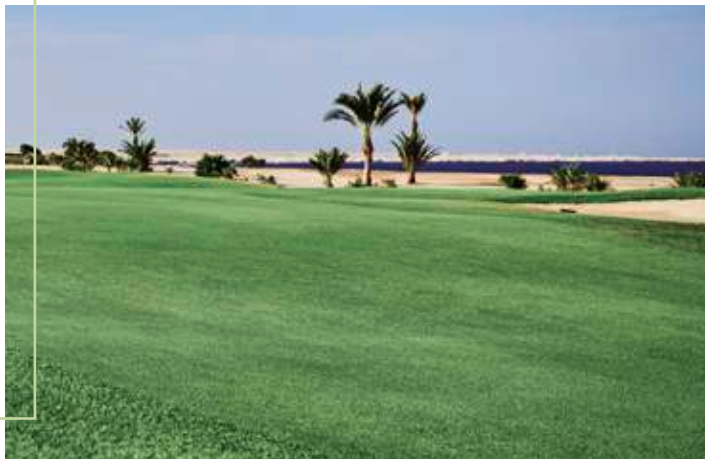
Hurghada: Golfen zwischen Wüste und Meer

Im El Gouna Golf Club müssen Tee-Times vorab angefragt werden. Vor allem in der Wintersaison, die vom 1. Oktober bis 30. April dauert, wird dies frühzeitig empfohlen; zu dieser Zeit wird außerdem ein Handicap von maximal 45 verlangt.