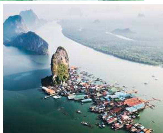
Auf Stelzen gebaut: das Dorf Ko Panyi