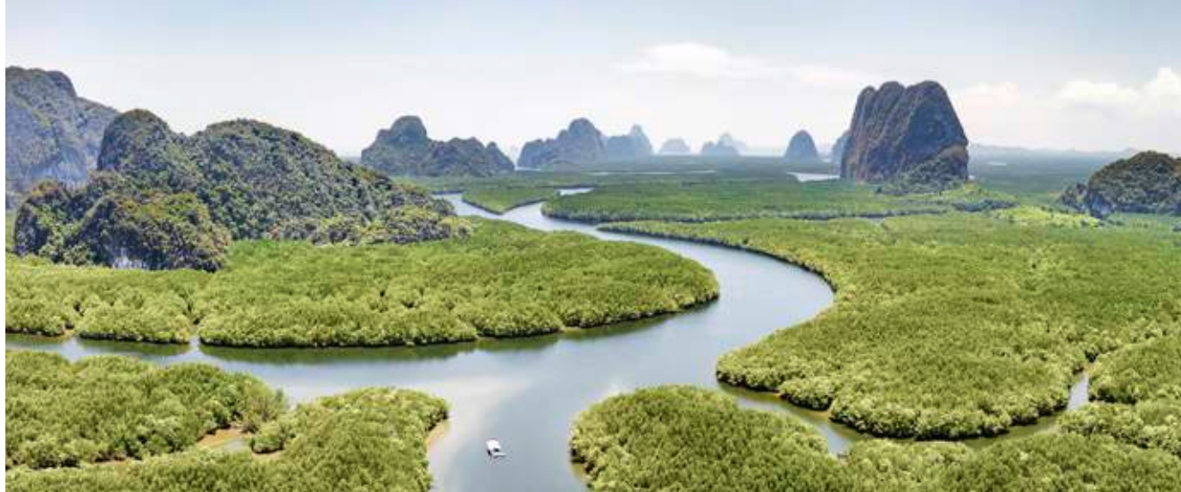
Kalksteinspitzen und Mangrovenwälder: die ursprüngliche Phang-Nga-Bucht