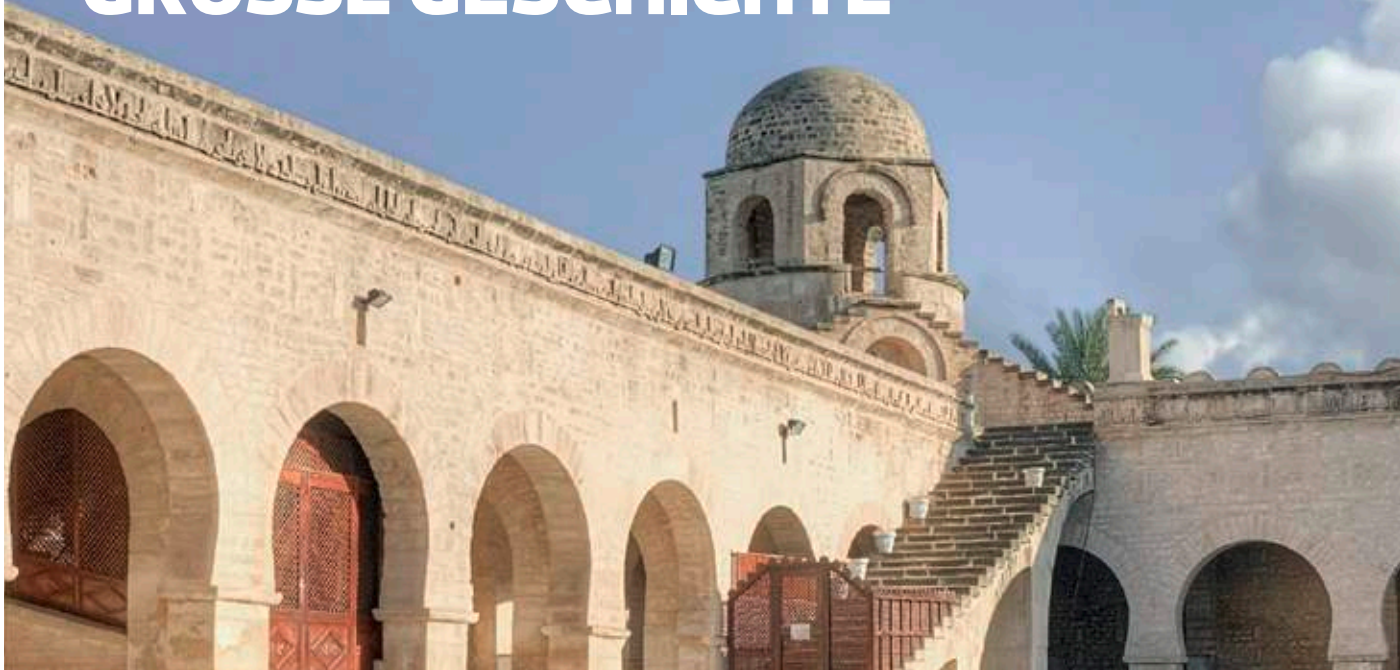
Erbaut im 9. Jahrhundert: die Große Moschee in Sousse

Tunesien ist Afrikas kleinstes Land – und dabei voller Geschichte und Kultur, voller Farben und Sehenswürdigkeiten. Die berühmten Ruinen von Karthago, kunterbunte Märkte voller Exotik und die Insel Djerba mit all ihren Schätzen warten darauf, erkundet zu werden. Tunesien verspricht eine Auszeit mit außergewöhnlichen Erfahrungen.