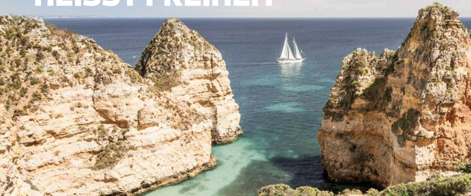
Algarve – Portugals malerischer Süden

Im Gegensatz zu einem Kurzurlaub oder einer Ferienreise, die in der Regel nur wenige Tage oder Wochen dauern, erstreckt sich ein Langzeiturlaub über 3 Wochen bis hin zu mehreren Monaten. Diese Zeit ermöglicht intensivere Erfahrungen: Man taucht tief in die Kultur und das Leben vor Ort ein, erholt sich ausgiebig, kann längere Ausflüge und Aktivitäten unternehmen und: So eine Auszeit bietet alle Freiheiten, seine Erlebnisse flexibel zu gestalten.