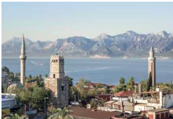
Auch ohne Boot erreichbar: das Taurus-Gebirge