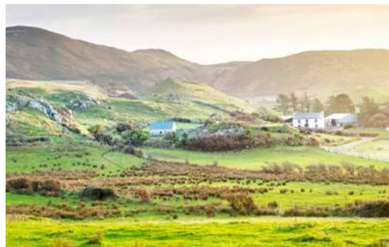
Land zum Durchatmen. Die grüne Insel Irland.

Ein Sabbatical ist eine geplante berufliche Pause, in der Menschen sich erholen, weiterbilden oder andere Ziele verfolgen können. Ein mögliches Ziel kann der Wunsch sein, die Welt zu entdecken und in andere Kulturkreise einzutauchen. Die Arbeit kann warten!