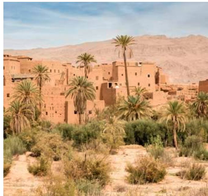
Marokko – eines der faszinierendsten Länder des Orients

Dem Alltag richtig entfliehen, sich für länger an einem sonnigen Ort niederlassen und Wohlfühl-Atmosphäre genießen – dazu braucht es die passende Unterkunft. Die Anforderungen dabei sind anders als bei einem kurzen Aufenthalt. So verfügen die geeigneten Hotels und Apartment-Anlagen bei DERTOUR über eine Vielzahl von besonderen Angeboten, von Sprach-, Koch- oder Sportkursen über Wäsche-Service und mehreren Verpflegungsvarianten bis hin zu Ermäßigungen, die auch längere Aufenthalte erschwinglich machen.