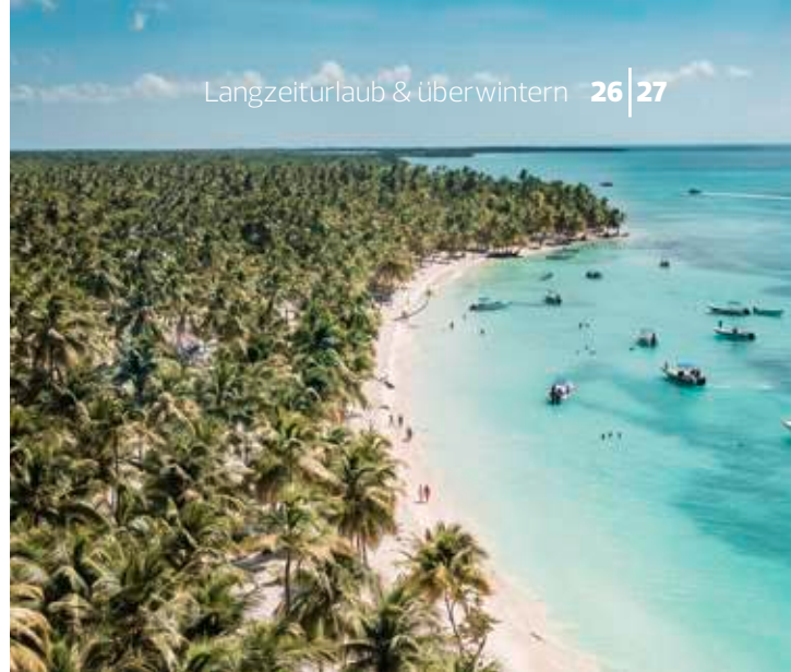
Insel-Paradies des Nationalparks Cotubanamá: Saona

Wer eine längere Auszeit plant, tut gut daran, vorab ein paar Gedanken anzustellen: All-Inclusive-Versorgung oder lieber eine eigene Küche? Wie sind die Lebenshaltungskosten? In welchen Sprachen kann man sich verständigen? Und wie ist die medizinische Versorgung, wenn's mal zwickt? Ist dann das passende Überwinterungsziel gefunden, wird man mit Sonne, Erlebnissen mit Gleichgesinnten und viel Erholung belohnt. Und spätestens der Plausch mit dem vertrauten Stammpersonal macht das Winterquartier zum Wohlfühl-Zuhause.